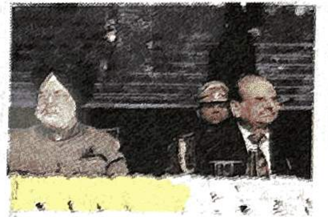
Union Minister Hardeep Puri at DDA's 67th Sansthapana Diwas. PIB

EXPRESS NEWS SERVICE NEW DELHI, DECEMBER 28