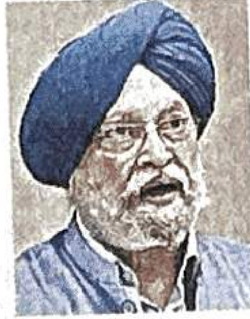
हरदीप सिंह पुरी

वि, नई दिल्ली : केंद्रीय आवासन और शहरी कार्य मंत्री हरदीप सिंह पुरी ने कहा कि दिल्ली विकास प्राधिकरण (डीडीए) के प्रयास से दिल्ली विश्व स्तरीय शहर बनने की राह पर है। विकास में आर्थिक रूप से कमजोर वर्ग की भागीदारी सुनिश्चित की जा रही है। वह बुधवार रात द्वारका स्थित यशोभूमि में आयोजित डीडीए के 67वें स्थापना दिवस समारोह को संबोधित कर रहे थे।