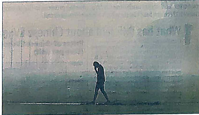
The 24-hour average AQI reading was 364 at 4pm on Wednesday.