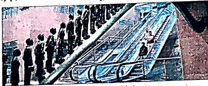
कुछ इस तरह बनेगा इंटरचेंज मेट्रो स्टेशन।

इंद्रलोक-इंद्रप्रस्थ कॉरिडोर ब्रिगेडियर होशियार सिंह स्टेशन से इंद्रलोक कॉरिडोर (ग्रीन लाइन) का विस्तार है। यह 12.4