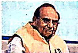
Delhi L-G V K Saxena

"On the date of the visit on 03.02.2024", he "asked officers/officials at the spot to expedite work... the project being related to medical facilities for paramilitary forces serving the nation and (as) resources to the