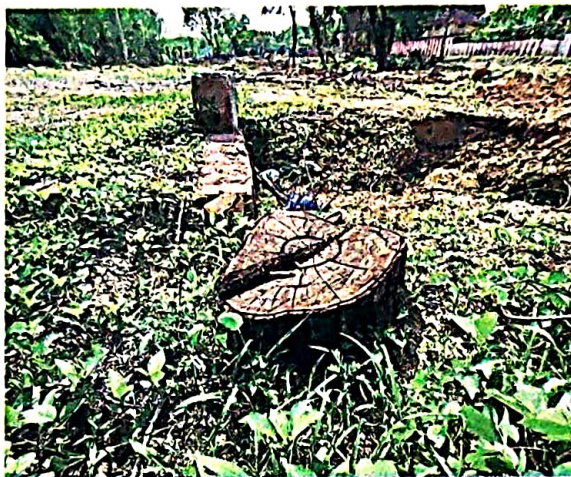
The L-G said 174 trees were cut in the non-forest area while 468 trees were axed in the forest part. FILE PHOTO

Mr. Saxena said he had visited the CAPFIMS Hospital site on February 3 for an inspection and had "asked