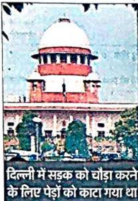
दिल्ली में सड़क को चौड़ा करने के लिए पेड़ों को काटा गया था

गलत प्रशासनिक निर्णय का नतीजा : पीठ ने डीडीए अधिकारियों पर जुर्माना लगाता हुए कहा कि मामला गलत प्रशासनिक निर्णय की श्रेणी में आता है, क्योंकि 1996 के एक फैसले के तहत पेड़ों की कटाई से पहले आवश्यक मंजूरी