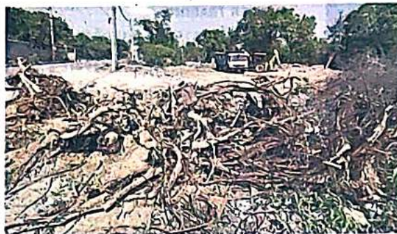
Around 1,100 trees were cut down in the Ridge in February 2024. Tree felling in the area is not allowed without the SC's permission. FILE PHOTO

"Without delving into excessive detail, it is an admitted position that the former DDA vice-chairperson (Subhashish Panda) and officials of the DDA acted in an errant manner, which not only amounted