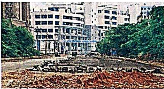
The case was related to widening of the road to the under-construction Central Armed Police Forces Institute of Medical Sciences.

The top court's judgment by a bench of Justices Surya Kant and