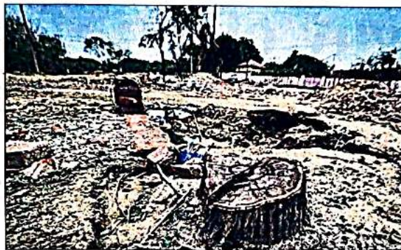
Remnants of trees on Chhattarpur Satbari-Gaushala road.

"It is only the overwhelming public interest served by the establishment of CAPFIMS that has, in effect, overshadowed the sheer administrative incompetence and blatant disregard for both established procedures and the orders of court," it observed.