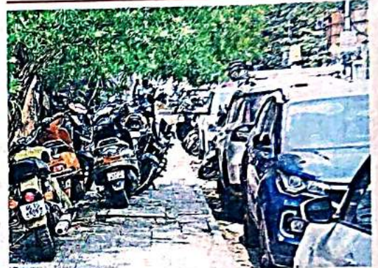
दीपाली चौक के पास सर्विस लेन व फुटपाथ पर खड़े वाहन

• पैदल चलने के लिए फुटपाथ पर भी नहीं बची है जगह