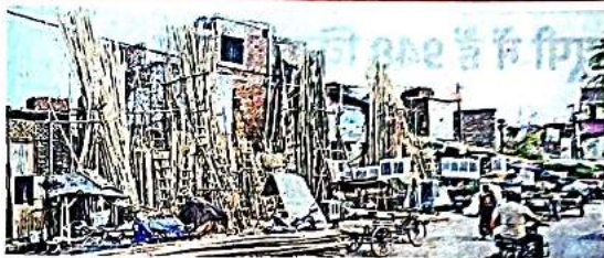
गुरु रविदास मार्ग पर भूमिहीन कैंप के लोगों द्वारा किया गया अतिक्रमण • जागरण

कहा-अतिक्रमणकारियों के पास पुनर्वास की मांग करने का कोई संवैधानिक अधिकार नहीं