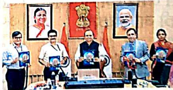
राजनिवास में 'अपना घर आवास योजना 2025' की विवरण पुस्तिका को लांच करते एलजी वीके सक्सेना, डीडीए के उपाध्यक्ष एन ब्रज कुमार, वरिष्ठ आइएसएस आशीष कुंदा व अन्य

नई योजना में लोकनायकपुरम, सिरसपुर और नरेला में ईडब्ल्यूएस, एलआइजी, एमआइजी और एचआइजी श्रेणी के कुल 7,500 फ्लैट्स हैं। इसकी बुकिंग 27 मई से शुरू होगी। इसमें नरेला में एचआइजी श्रेणी में 226 फ्लैट, नरेला व लोककल्याणपुरम में एमआइजी श्रेणी में 482 फ्लैट हैं। शेष 7,018 फ्लैट ईडब्ल्यूएस और निम्न आय वर्ग (एलआइजी)