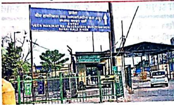
सराय काले खां स्थित वीर हनुमंत राय अंतरराज्यीय बस अड्डा • जागरण

• बसों में सवारी बैठाने के लिए तेज आवाज लगाकर सवारियां बैठाने की अनुमति नहीं होगी