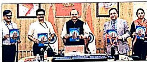
उपराज्यपाल लॉन्च करते उपराज्यपाल वीके सक्सेना। अमर उजाला

इसमें 7500 फ्लैटों पर 15-25% की छूट दी जा रही है। 27 मई से बुकिंग शुरू होगी जो 26 अगस्त तक चलेगी। योजना के साथ दिन-रात चैट-बॉट सेवा भी शुरू की गई है, जिससे खरीदारों को आसानी से जानकारी मिलेगी। योजना में 18 साल से अधिक उम्र के वे भारतीय नागरिक जिनके पास दिल्ली में कोई आवासीय संपत्ति नहीं