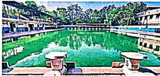
मंगोलपुरी के सी ब्लॉक के सर्वोदय कोएड विद्यालय के स्विमिंग पूल के पानी में जमी काई, जिससे इसमें तैराकी सीखने वालों को हो सकता है संक्रमण • जागरण

दिल्ली में प्रत्येक स्विमिंग पूल पर लगभग 300 बच्चे अभ्यास करते हैं। इस तरह कुल मिलाकर