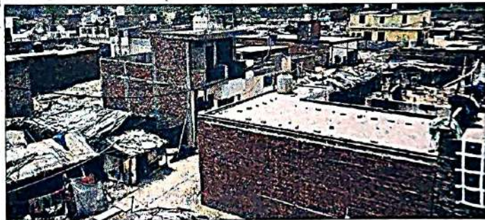
श्रम विहार के यमुना डूब क्षेत्र में किया गया अतिक्रमण।

याचिकाकर्ताओं ने किया वैधता का दावा : याचिकाकर्ताओं ने दावा किया कि वे खसरा नंबर 482 और 483 पर स्थित अपनी जमीन पर वैध रूप से काबिज हैं, जो अब श्रम विहार, अबुल फजल एन्क्लेव के नाम से जानी जाती है। उनके पास बिजली बिल, हाउस टैक्स रसीदें और अनरजिस्टर्ड