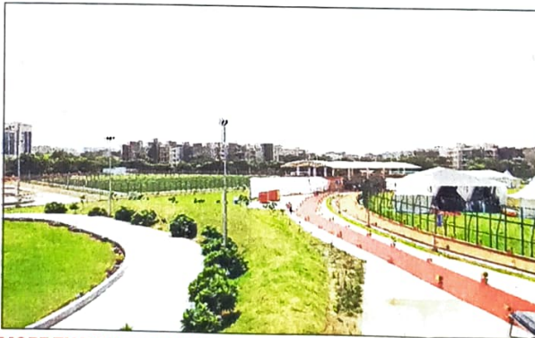
MORE THAN JUST SPORTS

He assured that the move would not lead to any chaos at the sports complexes as everything would be implemented in a planned manner. "After increasing the operational hours of Qutab Golf Course till 1am, the footfall has increased there. We will implement the same timings at the sports complexes," the official added.