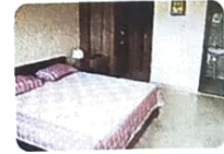
Actual pictures of the sample flat

For Registration and further updates, log on to: www.dda.gov.in www.eservices.dda.org.in