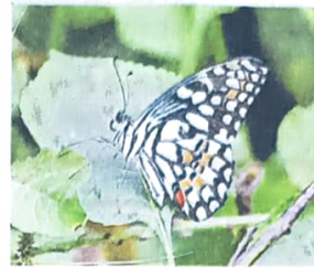
लाइम बटरफ्लाई • सौजन्य- बायोडायवर्सिटी पार्क