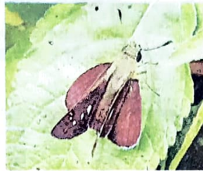
ब्लैक स्वीफ्ट