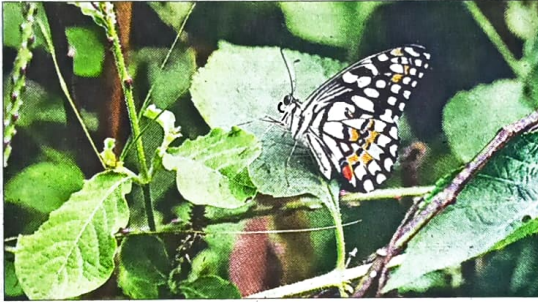
जैव विविधता पार्क में दुर्लभ तितली।

पर्यावरण को स्वस्थ रखने के लिए जैव विविधता की अहम भूमिका है। बदलते पर्यावरण के चलते जीव-जंतुओं की कई प्रजातियां विलुप्त होने की श्रेणी में पहुंच गई हैं। इन्हीं में तितली की भी कई दुर्लभ प्रजातियां विलुप्त हो रही हैं। ऐसे में सात जैव विविधता पार्कों में 30 अक्तूबर से चार नवंबर तक चले तितली मूल्यांकन सप्ताह में 75 प्रजातियों की गणना की गई। पिछले वर्ष 76 प्रजातियों की गणना की गई थी। इसमें यदि अक्टूबर 2023 के मौसम संबंधी आंकड़ों की तुलना पिछले 2 वर्षों से करें, तो इस वर्ष बारिश के दिनों की संख्या