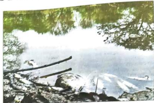
Dead fish floating on the surface of the pond.

In a similar incident in July last year, hundreds of fish were found dead in the Najafgarh drain, resulting in the National