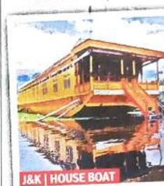
J&K | HOUSE BOAT

About the place | It is divided into nine petals and one main sarovar (waterbody) in the middle