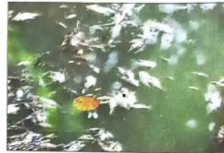
The pond is one of the oldest in the region