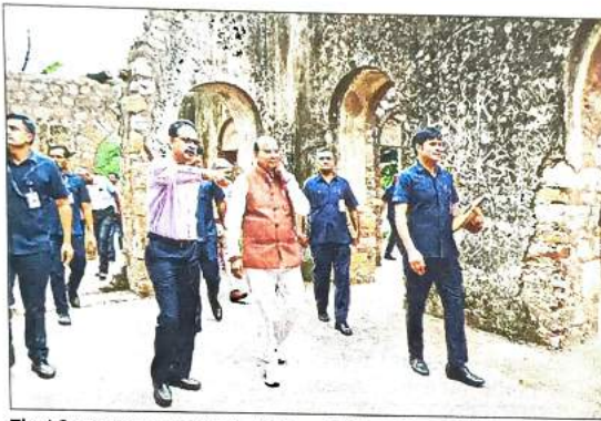
The LG was accompanied by Union minister Meenakshi Lekhi

Spread in 65 hectares of land, the Mehrauli Archaeological Park has nearly 80 monuments and historical structures including Balban's Tomb, Jamali Kamali Mosque and other historical structures, apart from the iconic Qutub Minar.