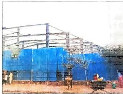
कोर्ट में पेश की गई अस्थायी निर्माण की फोटो