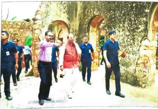
L.G. Saxena at the Mehrauli Archaeological Park on Saturday.

NEW DELHI: Delhi lieutenant governor (LG) VK Saxena on Saturday directed the authorities concerned to work out a time-bound plan to restore and preserve heritage sites at the Mehrauli Archaeological Park, and remove encroachments around it, officials aware of the matter said. The LG also asked officials to preserve any carved stones or relics found at the site during the restoration works, which will be displayed inside an upcoming museum at the location, the officials said.