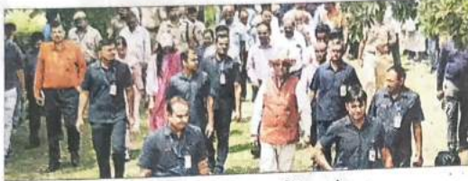
महरोली पुरातत्व पार्क में उपराज्यपाल वीके सक्सेना।

नई दिल्ली। राजधानी के ऐतिहासिक स्थलों के दिन भी बहुरंगे। इसकी कमान भी दिल्ली के उपराज्यपाल वीके सक्सेना ने संभाल ली है। उन्होंने बलबन के मकबरे, जमाली-कमाली मस्जिद, राजाओं की बावली के लिए जल्द से जल्द एक निश्चित समय सीमा के साथ एक पुनरुद्धार योजना पर काम करने को कहा है।