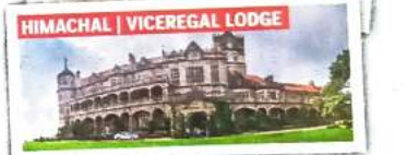
HIMACHAL | VICEREGAL LODGE