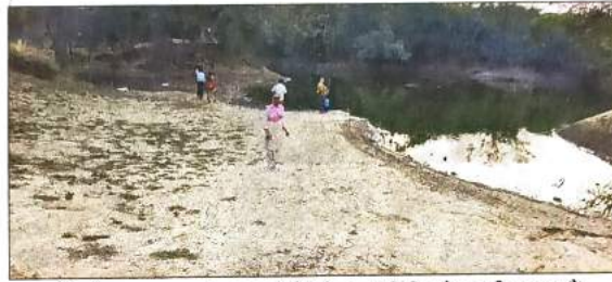
झील के आसपास लोग आ रहे हैं और वह डीडीए से काफी नाराज हैं

तीन क्विंटल के करीब मछलियां निकाली जा चुकी हैं, अब भी काफी संख्या में मछलियां झील में दिख रही हैं