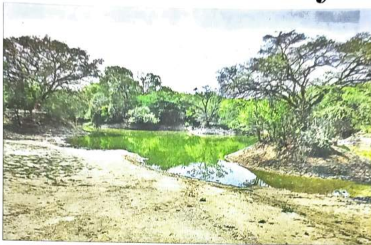
The 1.5 acre pond in Dwarka Sector 23 was revived by residents of the area.

"Upon approaching the lake, we saw several dead fish floating on the surface. Others appeared to be struggling to get oxygen