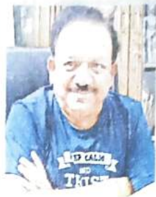
सांसद डा. हर्षवर्धन