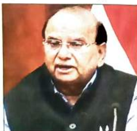
नए रोजगार पैदा होंगे।

दिल्ली में औद्योगिक विकास को बढ़ावा देने के लिए उप-राज्यपाल वी.के. सक्सेना ने एक महत्वपूर्ण निर्णय के तहत बाहरी दिल्ली के कंझावला और बापरौला इलाके में नए इंडस्ट्रियल एरिया डिवेलप करने के प्रस्ताव को मंजूरी दे दी है। एलजी ने कंझावला में 920 एकड़ भूमि को औद्योगिक क्षेत्र के रूप में विकसित करने की मंजूरी दी है। वहीं बापरौला गांव में भी अतिरिक्त 300 एकड़ भूमि को औद्योगिक क्षेत्र के रूप में विकसित करने का मार्ग प्रशस्त किया है। एलजी ने डीडीए के परामर्श से दिल्ली सरकार के उद्योग विभाग को इन दोनों इलाकों में चिह्नित की गई भूमि के उपयोग को बदलने का निर्देश दिया है। उन्होंने उम्मीद जताई कि इस पहल से दिल्ली के इन उपेक्षित इलाकों में औद्योगिक विकास को बढ़ावा मिलेगा और