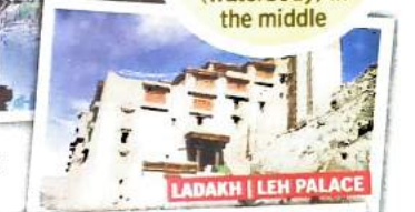
LADAKH | LEH PALACE