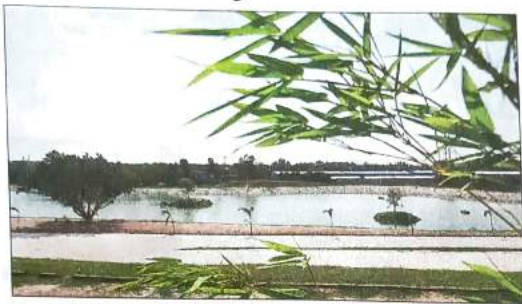
This waterbody is about three metres deep, spreading over 5 acres and can hold 35 lakh litres at a time, sourced through nearby STP installed at Smriti Van

A DDA official said: "The DMRC came to us with a proposal to install a musical fountain of 10m width, 90 m length and 8 m (25 ft) height in the waterbody in middle of the park and we have agreed to the project. We have already installed six small fountains for aeration and for improving biochemical oxygen demand (BOD)