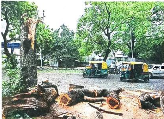
Last year, the DDA had requested the MoEFCC to allow compensatory afforestation in neighbouring states of Delhi, citing scarcity of land in the capital.

The forest clearance application submitted in February is for the new Bijwasan terminal of the Northern Railway. According to documents submitted for clearance, a separate passenger and goods handling facility is proposed at Bijwasan to cope with "future traffic needs and decongest existing ones" for which the Delhi Development Authority (DDA) has "earmarked approximately 110 hectares of land at