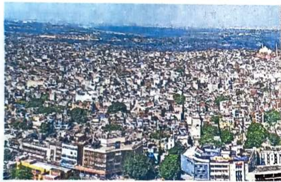
दिल्ली 2041 में अभी के स्वरूप से काफी बदल जाएगी

नए मास्टर प्लान में बुनियादी बातों का रखा ध्यान, खास फोकस पर्यावरण पर