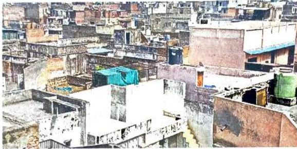
पुरानी दिल्ली के चांदनी चौक के समीप किनारी बाजार, जहां घनी आबादी के साथ जर्जर भवन कभी भी हादसे को दे सकते हैं दावत

प्राकृतिक आपदाओं के लिए भी संवेदनशील है दिल्ली : राजधानी की नियमित कालोनियों में बिल्डर फ्लैट के चलन से भी आबादी कई गुणा बढ़ती जा रही है। आबादी बढ़ने व सुविधाएं सीमित रहने की वजह से सिस्मिक जोन-4 में शामिल दिल्ली प्राकृतिक आपदाओं के लिए संवेदनशील हो रही है। समस्या को दूर करने के लिए राजधानी में कई स्तरों पर प्लानिंग हुई है, री-डेवलपमेंट प्लान भी बने, लेकिन