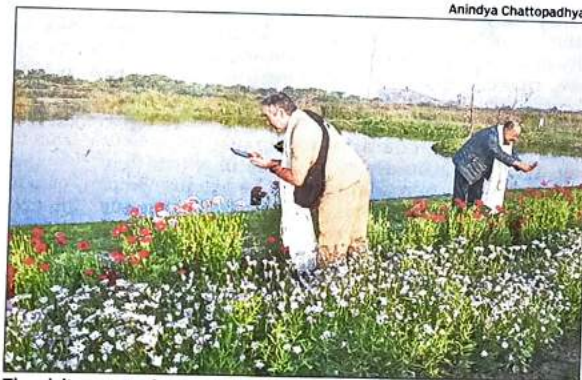
The visitors went for a walk & bird watching in the riverine ecosystem