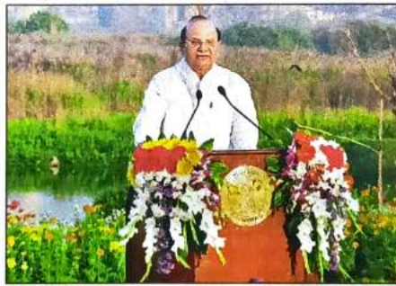
एलजी ने विदेशी प्रतिनिधियों की मेजबानी की

वीके सक्सेना ने कहा कि पहले यहां पर काफी कूड़ा था।