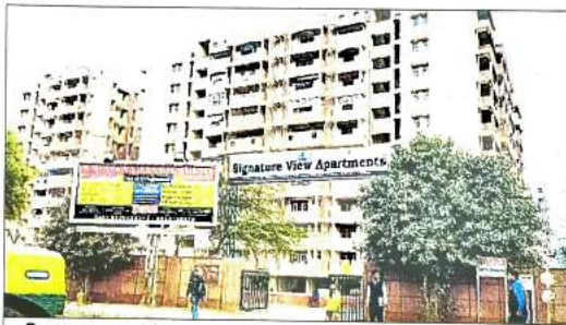
सिग्नेचर व्यू अपार्टमेंट • फाइल फोटो