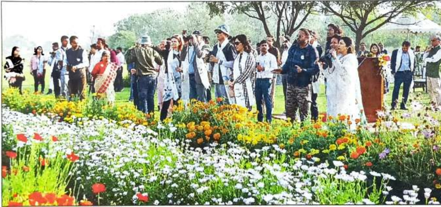
11 देशों के प्रतिनिधियों ने रविवार को यमुना नदी के किनारे पक्षियों के बीच गुजारा अपना वक्त