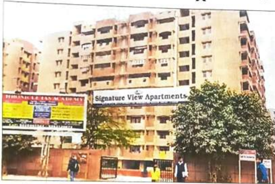
मुखर्जी नगर का सिग्नेचर व्यू अपार्टमेंट 2007-09 में बना, 2011-12 में अलॉट हुआ