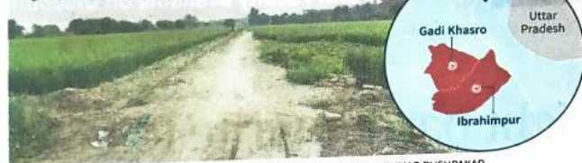
Land at Gadi Khasro village, which is part of LPP's Sector 8-B. SHIV KUMAR PUSHKAR

forming of a consortium that can collaborate with a developer entity or plan the development on its own after surrendering 40% of the pooled land to the DDA for public infrastructure works.