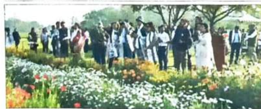
G-20 delegates at the flood plains of the River Yamuna

plain remains fragile, efforts are being made to restore and rejuvenate Delhi's natural heritage that is crucial for making Delhi environmentally sustainable with a refurbished green-blue ecosystem," he said.