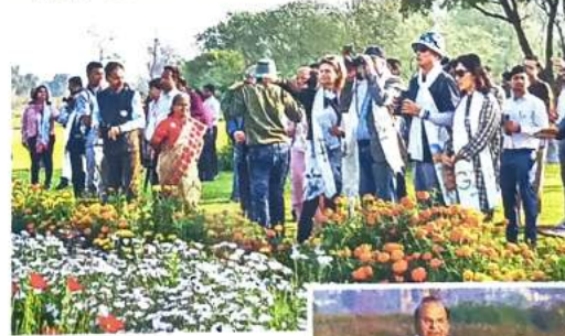
भास्कर न्यूज़ | नई दिल्ली