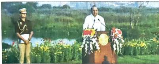
Delhi Lt Governor VK Saxena addresses envoys