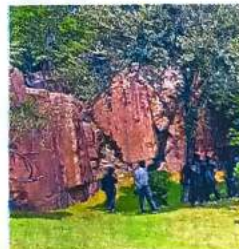
संजय वन में प्रकृति का आनंद लेने पहुंचे पर्यटक ● लौ. आर्योजक

जागरण संवाददाता, दक्षिणी दिल्ली : राजधानी में रविवार से बर्ड फेस्टिवल का आगाज होने जा रहा है। संजय वन में लगने जा रहे इस फेस्टिवल में नेचर वाक, पक्षी आधारित कला और शिल्प, वर्कशॉप आदि का आयोजन होगा। इसे दिल्ली विकास प्राधिकरण (डीडीए) और वर्ल्ड वाइड फंड फॉर नेचर - इंडिया (डब्ल्यूडब्ल्यूएफ इंडिया) द्वारा मिलकर मनाया जा रहा है। शुकुवार को वन्यजीव दिवस पर इसकी घोषणा की गई।