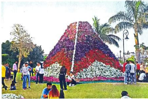
कनाट प्लेस स्थित सेंट्रल पार्क में फूलों की सजावट से बनाया गया पिरामिड