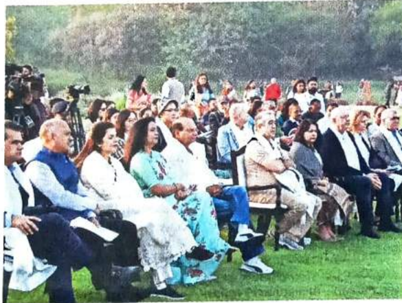
Ambassadors and diplomats of 11 countries visited the park and went on a nature trail and bird watching tour

"Asita has been our own effort at such rejuvenation. Just six months ago, this fragile riverine eco-system was a dump yard of waste, squatters and stray animals. Persistent efforts by the Delhi Development Authority has resulted in salvaging a self-contained ecosystem that houses rich natural diversity. Though the Yamuna floodplains remain fragile, efforts are on to restore and rejuvenate Delhi's