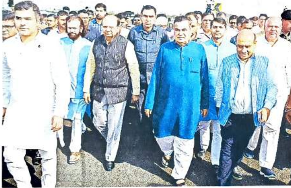
पश्चिमी रिंग रोड का निरीक्षण करते मध्य में सड़क परिवहन और राजमार्ग मंत्री नितिन गडकरी, एलजी वीके सक्सेना (बाए से तीसरे), सांसद प्रवेश वर्मा (बाए), हंसराज हंस (बाए से दूसरे) व अन्य

76 किमी लंबी इस रिंग रोड से हरियाणा, पंजाब और जम्मू कश्मीर से दिल्ली एयरपोर्ट व अन्य स्थानों पर आने वाली गाड़ियां दिल्ली के बाहरी इलाके से निकल जाएंगी। उन्हें दिल्ली में भीतर दाखिल होने की जरूरत नहीं पड़ेगी। यह रिंग रोड पश्चिमी दिल्ली, दक्षिणी दिल्ली, आइजीआइ एयरपोर्ट व गुडगांव को आपस में जोड़ेगी। इसके बनने के बाद दिल्ली के लोगों को भी आवागमन में सुविधा होगी।