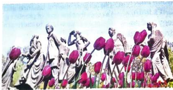
The L-G was informed that around 1.5 lakh tulips were planted across the NDMC area. Praveen Khanna

Raj Niwas officials said Saxena directed officials to come up with a detailed plan of action for the re-