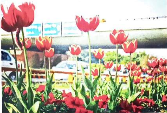
सभी एजेंसियों को 15 दिन में एक्शन प्लान बनाकर पेश करने के लिए कहा गया है

5 लाख ट्यूलिप बल्ब लगाने की योजना है अगले सीजन में