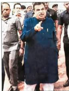
Union minister Nitin Gadkari during an inspection of UER II on Thursday.

The Union minister said that the first three packages of the road (total five), which are coming up in Delhi, will act as the third Ring Road in the Capital. He added that the road will also provide an alternative route to traffic emanating from various parts of Delhi, Gurugram and Faridabad, as well as with thousands of commercial vehicles headed to Punjab, Jammu and Kashmir, Himachal Pradesh and Chandigarh via Delhi, and vice versa. Two segments of UER II will be developed