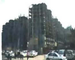
Delhi-2041 Draft Master Plan to be notified by March-end

"The DDA has already approved the draft Master Plan and we are in the process of sending it to the Ministry of Housing and Urban Affairs. We are hopeful that the ministry will approve it by the end of this month or by early April, following which it will be notified," said an official.