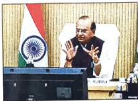
LG ने मीटिंग में दिए अहम निर्देश

कि बाहर से पौधे मंगाने के बजाय विभाग अपनी या दूसरी सरकारी नर्सरियों में ही ज्यादा से ज्यादा पौधे उगाएं।