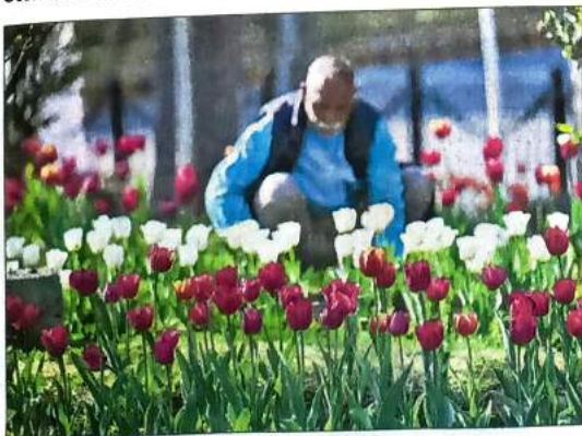
Tulips in full bloom on Shantipath in February.