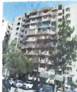
Signature View Apts

Lieutenant Governor V K Saxena, who is also the chairman of the Delhi Development Authority, had ordered the body to redevelop the apartments in Delhi's Mukherjee Nagar and proactively support the thousands of residents facing "grave danger to life and property". As part of the rehabilitation plan, three options have been given to the residents, said a senior DDA official.