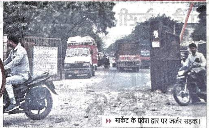
▶ मार्केट के प्रवेश द्वार पर जर्जर सड़क।