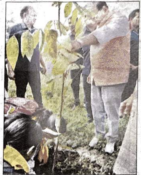
अंतरराष्ट्रीय वन दिवस पर उपराज्यपाल ने उत्तर पूर्वी दिल्ली में 11 किलोमीटर दायरे में यमुना बाढ़ के मैदानों की बहाली को पौधरोपण अभियान शुरू किया।

■ केंद्रीय मंत्री भूपेंद्र यादव के साथ एलजी ने लगाए 5000 पौधे