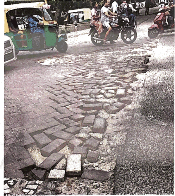
लाल बहादुर शास्त्री मार्ग पर तिराहे पर मिलने वाली टूटी एनबीसीसी प्लाजा रोड

कई माह से खराब हैं स्ट्रीट लाइटें मदनगीर डीडीए फ्लैट्स के पास लाल बहादुर शास्त्री मार्ग पर लगी सारी स्ट्रीट लाइटें कई माह से खराब हैं। इससे रात में यहां गहरा अंधेरा रहता है। सुबह जल्दी मॉर्निंग वाक पर निकले लोगों को अंधेरे की वजह से कई बार चोट भी लग जाती है, क्योंकि साइकिल ट्रैक और फुटपाथ पर जगह-जगह तार और सरिये निकले हुए हैं और कई जगह पर ये टूटे भी