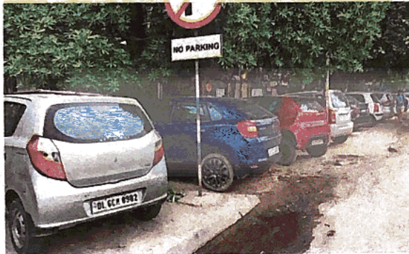
लाल बहादुर शास्त्री मार्ग पर फुटपाथ व साइकिल ट्रैक पर खड़े वाहन

लाल बहादुर शास्त्री मार्ग पर मदनगीर गांव से लेकर मदनगीर डीडीए फ्लैट्स होते हुए खानपुर तक गंदगी और अवैध पार्किंग की समस्या से लोगों को काफी परेशानी हो रही है। मदनगीर डीडीए फ्लैट्स से लेकर खानपुर तक मौजूद फुटपाथ कार स्वामियों के लिए पार्किंग का मुख्य स्थान बन गए हैं। सड़क के दोनों ओर अनगिनत कारें खड़ी दिखाई देती हैं। जो फुटपाथ खाली हैं, वे कई जगह टूटे व उखड़े हैं। इससे पैदल चलने वालों को अक्सर चोट भी लग जाती है। लाल बहादुर शास्त्री मार्ग पर मिलने वाली एनबीसीसी प्लाजा रोड तो मुख्य तिराहे पर ही उखड़ी हुई है, जिससे अक्सर बाइक सवार वहां फंसकर गिर जाते हैं। वहीं, मदनगीर डीडीए फ्लैट्स के पास बने साइकिल ट्रैक पर बाइक सवार अक्सर तेजी से