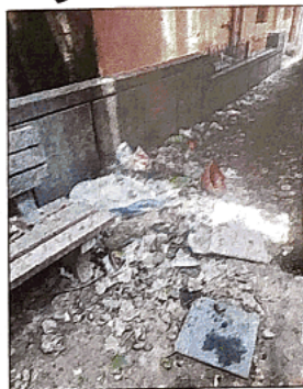
लोगों ने बताया कि कॉलोनी की नियमित रूप से सफाई नहीं होती है

लोगों ने बताया कि पहली बरसात के बाद पानी की निकासी नहीं हो पाई थी। उसके बाद दूसरी बारिश का पानी भी