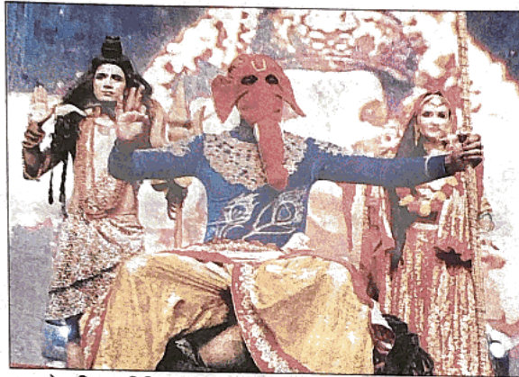
650 से अधिक कमिटियां एक बार फिर रामलीला कराने की तैयारियां कर रही हैं