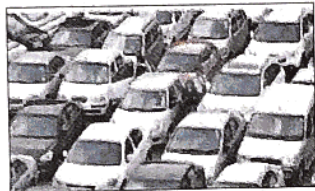
सड़क पर वाहनों का भार कम करने व मल्टीलेवल कार पार्किंग योजना को कामयाब करने की कवायद

सूत्रों के अनुसार डीडीए ने मास्टर प्लान 2041 में एनडीएमसी, एमसीडी और अन्य विभागों की मल्टीलेवल कार पार्किंग परियोजनाओं को कामयाब करने की दिशा में प्रावधान करने का निर्णय लिया है। इस कड़ी में इन पार्किंग के आसपास ऑन स्ट्रीट पार्किंग को खत्म करने की निर्णय लिया जा रहा है। दरअसल मल्टीलेवल कार पार्किंग में कार खड़ी करने एवं बाहर निकालने में समय लगता है इसके कारण लोग अपनी कार पार्किंग में खड़ी करने के बजाए ऑन स्ट्रीट पार्किंग की प्राथमिकता देते हैं। डीडीए ने केन्द्रीय आवास और शहरी मंत्रालय से ऑन