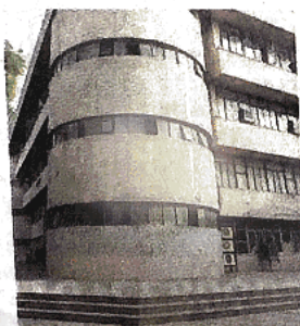
DDA headquarters

"These suggestions have now been successfully incor-