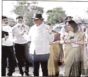
उपराज्यपाल ने जगह-जगह रुक कर अधिकारियों के साथ बातचीत भी की