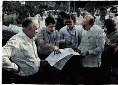
के बीच समन्वय की आवश्यकता पर जोर दिया। एलजी के साथ मुख्य सचिव

इस दौरान उनके निर्देश पर दिल्ली नगर निगम ने राष्ट्रीय राजमार्ग प्राधिकरण पर पांच लाख और लोक निर्माण विभाग पर भी पांच लाख जुर्माना लगाया। दोनों विभागों को ये जुर्माना तीन दिन में जमा करना होगा। इसके साथ ही उन्होंने शहर के बुनियादी ढांचे के उन्नयन और सौंदर्यकरण के लिए विभिन्न सरकारी एजेंसियों एवं शहरी स्थानीय निकायों