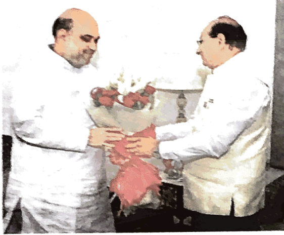
गृहस्थितार को गृह मंत्री अमित शाह से मुलाकात के दौरान मुकुंदरा भट्ट करते दिल्ली के उपराज्यपाल विनय कुमार सक्सेना