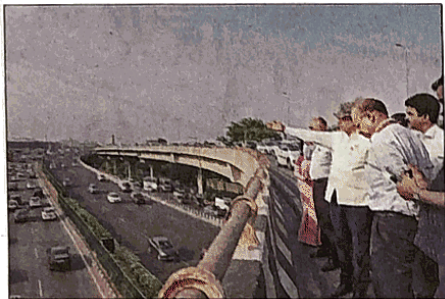
Saxena stopped at 15-20 locations, including Mandi House roundabout, Sardar Patel Marg, Dhaura Kuan, Subroto Park and Mahipalpur

Officials said Saxena stopped at 15-20 locations on the route, including the Mandi House roundabout, Sardar Patel