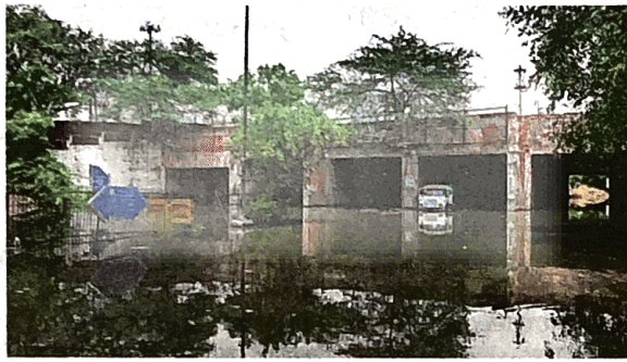
पुलप्रहलादपुर अंडरपास में भरा पानी

• पीडब्ल्यूडी 132 स्थानों पर पंप लगावाकर निकलवाएगा पानी