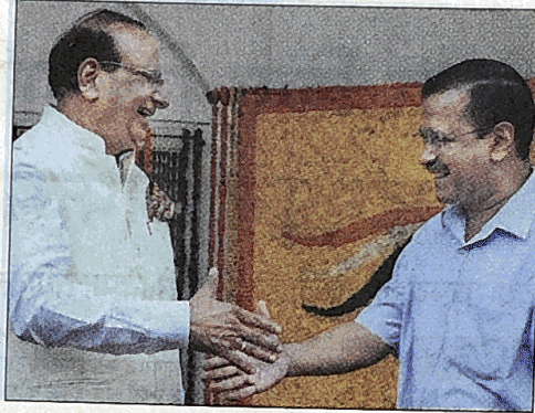
केंद्रीय गृहमंत्री अमित शाह से मुलाकात करते उपराज्यपाल विनय सक्सेना। वहीं, उन्हें बधाई देते सीएम केजरीवाल।