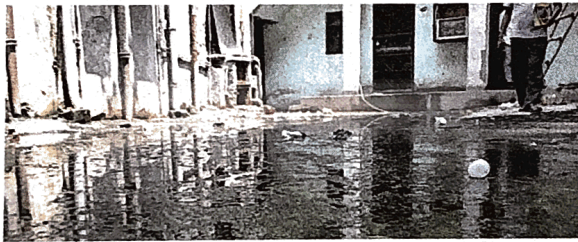
डीडीए फ्लैट्स स्थित पाकेट-11 में भरे पानी में जमी काई

ये इलाका एमसीडी को डिनोटिफाइड है जिसका मतलब है कि बिल्डिंग एक्टिविटीज से संबंधित सारी जिम्मेदारी एमसीडी की है।