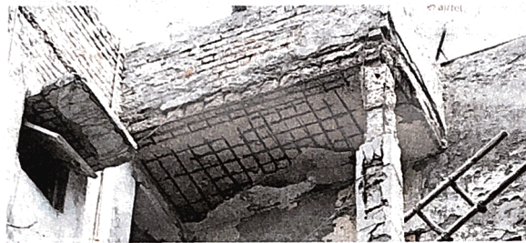
जसोला डीडीए फ्लैट्स में स्थित पाकेट-11 में जर्जर इमारत • जागरण

जसोला स्थित डीडीए फ्लैट्स के पाकेट-11 के निवासियों के अनुसार, इन फ्लैट्स के देखरेख मरम्मत व साफ-सफाई की जिम्मेदारी डीडीए और एमसीडी के बीच बंटी हुई है।