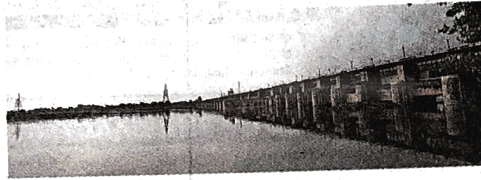
Projects proposed along the river and floodplains are required to obtain approval of the committee.