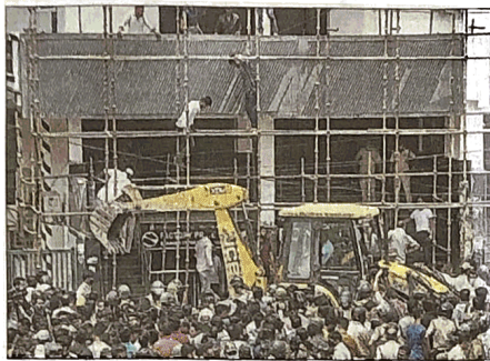
During the anti-encroachment drive at Shaheen Bagh.