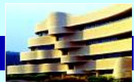
Rajiv Gandhi Cancer Hospital

Rohini besides a number of private clinics, dispensaries and hospitals also has Rajiv Gandhi Cancer Hospital, a fact that goes to say that Rohini is already at par with some of the more developed parts of Delhi when it comes to health.