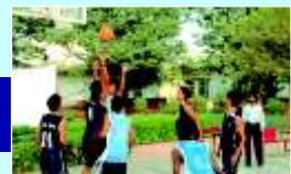
Rohini Sports Complex

Rohini has a full-fledged, Multi-games sports complex with courts and play fields for various sports and green areas for recreation and rejuvenation.