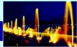
Swarn Jayanti Park

The fact that Delhi is the greenest city in India is evident from what you see in Rohini. DDA has developed the landmark Swarn Jayanti Park in this area besides which there are tree lined roads and various green areas and developed parks.